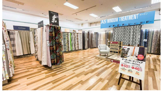
▲通路を広く取り、壁面側には各ブランドごとのシーン展開、中央側にはリビング・ダイニング・ベッドなど、ジャンルごとに比較検討し易い売場となっている。

通路からの間口を広く取り、回遊しやすい売場を心掛けています。新商品や主力商品中心の展開ですが、No.1800ダイニングといったロングセラー商品も根強い人気があります。再来のお客様も多いお店ですので、ご来店のたびに新たな魅力や発見を感じてもらえるよう、定期的な展示構成の見直し、販促物の更新、そして常日頃からの店舗スタッフとの情報共有を大事にしています。