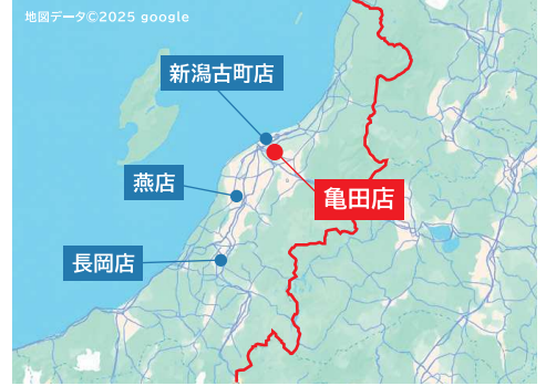
▲新潟市の2店舗に加え、燕市、長岡市にも店舗を構える山下家具店。

新潟県に4店舗を展開する株式会社山下家具店。1946年(昭和21年)に木工所として創業し、戦後復興・高度成長と共に家具卸・小売りへと事業を拡大、新潟に根差した老舗家具店として今に至ります。今回は、その旗艦店である亀田店を訪問しました。