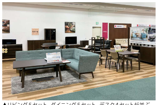
▲リビング5セット、ダイニング5セット、デスク4セットが並ぶ。