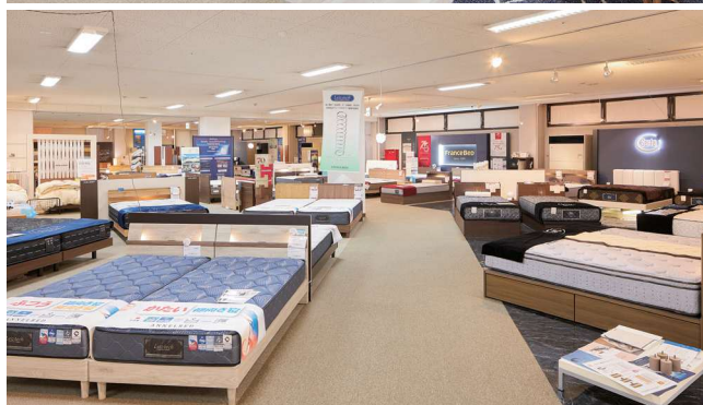
▲3フロア計2,000㎡の売場に、中価格帯から高価格帯まで、バランス良く展示されている。

新製品から定番品まで豊富に展示していただいております。スタッフの方々には当社製品の勉強会や工場見学会を行い、理解を深めてもらっています。また、定期的に同店主催の浜本工芸ショールーム販売会を行うことで相乗効果もできました。椅子やソファの張地色なども工夫し、お客様の夢が膨らむ売り場を維持・向上していきたいと思っております。