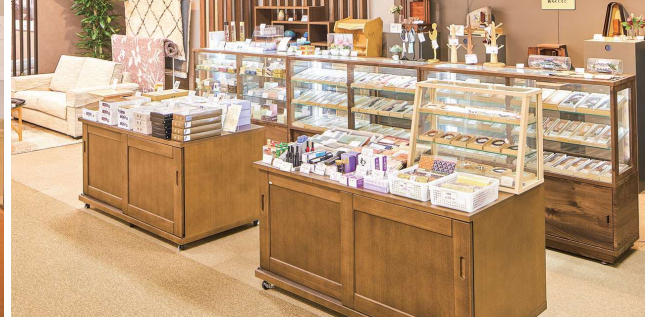
▲仏壇や仏具をゆっくりと選びながら、家具の買い換えを検討されるお客様も多い同店。