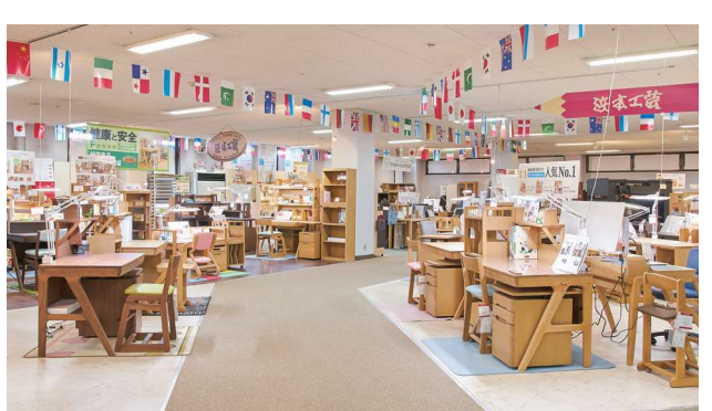
▲リビング12セット、ダイニング10セット、書斎3セット、学習机25セットが並ぶ。