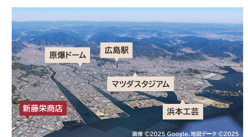
▲同店と浜本工芸とは車で15分の近距離に位置し、密なコミュニケーションが取れている。

1885年(明治18年)に創業し、創業140周年を迎えた新藤栄商店。創業当初は仏壇の製造からスタートし、家具卸、家具小売へと業態変化しながら、広島に根差し、地元密着の細やかな提案を大切にしている家具店です。