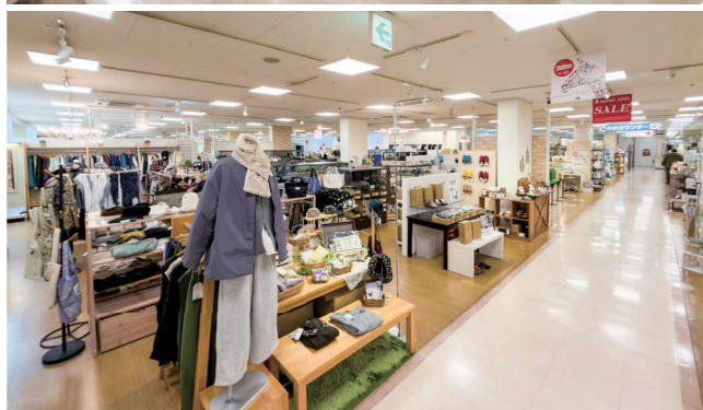
▲広大な実店舗ならではの多彩な品揃え。国内外の上質なブランドからコストパフォーマンスに優れたカジュアルなラインナップまでが一堂に会し、お客様の価値観を深掘りしていく。

No.7000チェアやNo.1000ソファ等、明るいトーンの商品を通路側の前列に並べ、お客様に興味を抱いていただき、奥に進むにつれて皮革張りのソファやフレンチオークのテーブルなど、素材と仕上がりをご体感いただくことで、浜本工芸の魅力を伝えています。スタッフの方々には「商品の価値と価格のバランスが良い」と好評で、安心感を持って積極的にお客様にお勧めいただいています。