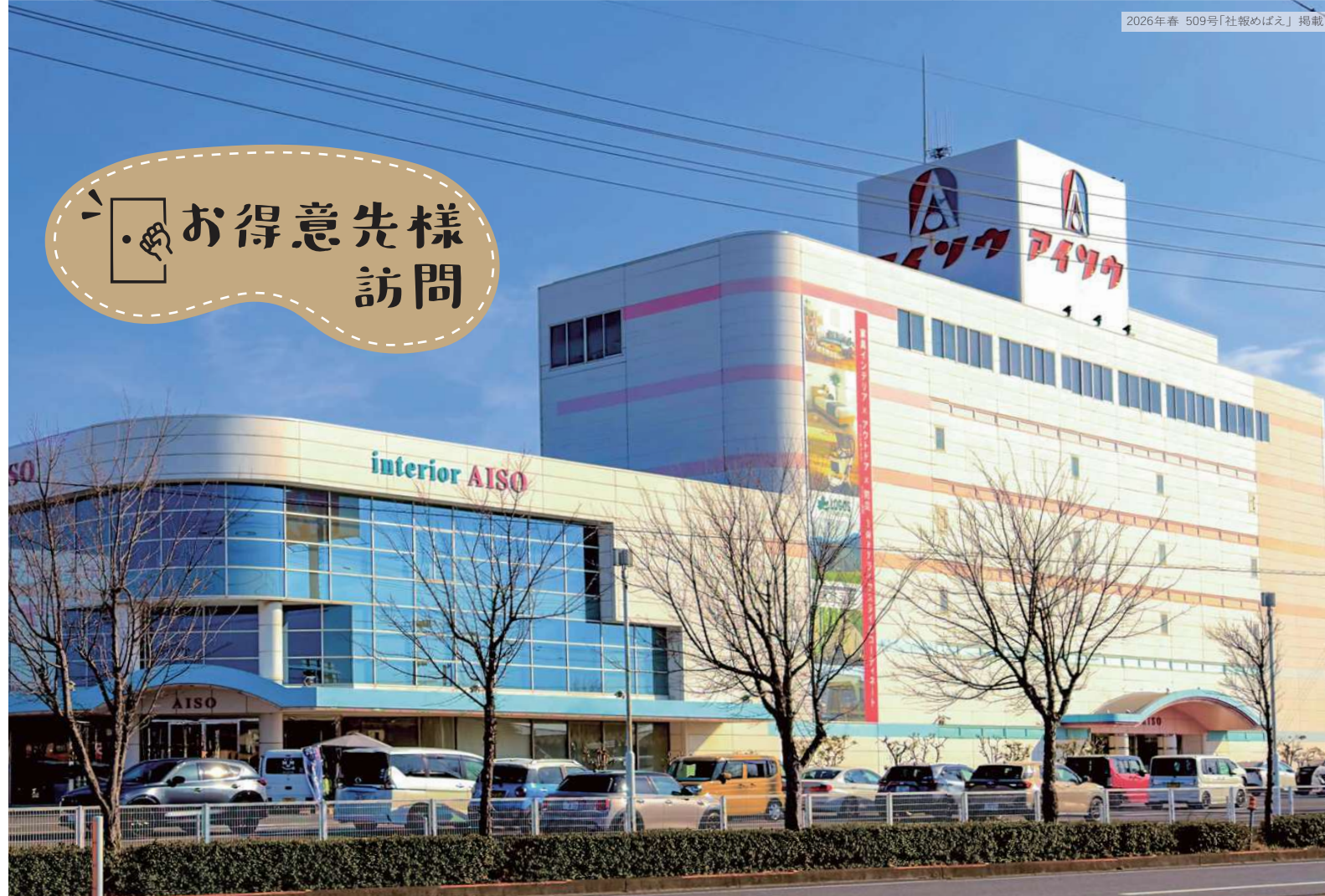
▲5階建て計17,000㎡(約5,000坪)の同店。

浜本工芸について 「派手さはないけれど、使い込むほどに良さが実感できる。そんな真面目な家具。」という印象です。特に中高年層の使い心地の良さにこだわる方や、より個人的なものをというよりも、長く愛着を持って使いたい、という方に自信を持ってお応えできています。リピーターの方が多くのも嬉しいですね。当店は浜本工芸の定番商品や新商品を余すところなく取り揃えていますので、広範囲なニーズにも柔軟にご提案できています。