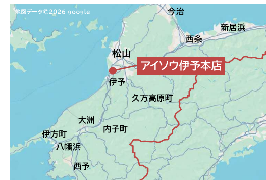
▲松山市と伊予市の境界付近。四国西部を巡る国道沿いに位置し高速インターからも近く、四国各県からの来店も多い。

四国最大級の家具専門店、アイソウ伊予本店。家具、ホームファッション、雑貨や衣料品まで、暮らしをトータルで彩るライフスタイルの提案を通して、長年地域に寄り添ってきました。価格帯やテイストも幅広く、若い新生活世代から、上質志向のご夫婦まで、それぞれの歩幅で家具選びを楽しめる空間が広がっています。