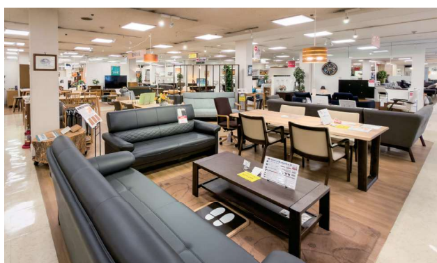
▲ダイニング7セット、リビングダイニング1セット、リビング9セット、机・書斎8セットが並ぶ。